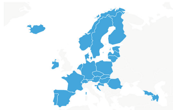
1 pav. EUROSTUDENT tyrime dalyvavusios šalys 2021-2024 m.

Pažymėtina tai, kad Lietuva šiemet mini dalyvavimo EUROSTUDENT tyrime 20-metį (Lietuva šiame projekte dalyvauja nuo 2005 m).